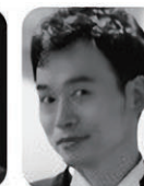
レメンダート バク・ドニール