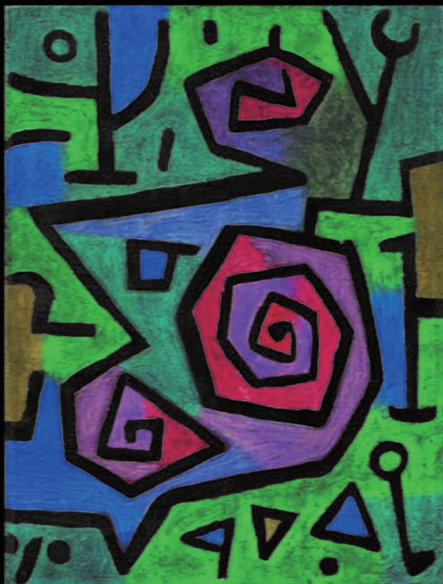
パウル・クレー 英雄的なバラ、1918年 ノルトライン・ヴェストファーレン州立美術館、デュッセルドルフ

合唱 オペラ彩合唱団 東邦音楽大学/東邦音楽短期大学/ 東邦音楽大学附属東邦第二高等学校 有志 放送大学埼玉学習センター合唱団 有志